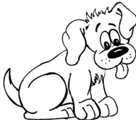
Това е куче. Кучето бяга.