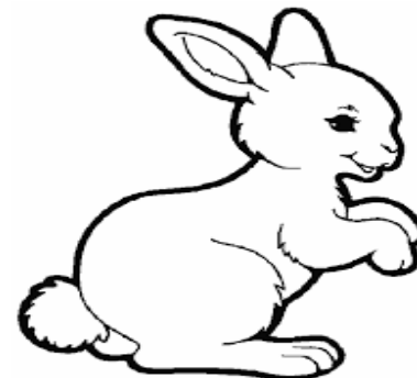
Това е заек. Заекът скача.