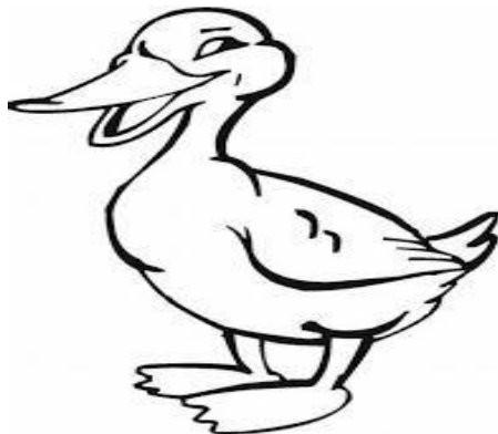
Това е пате. Патето плува.